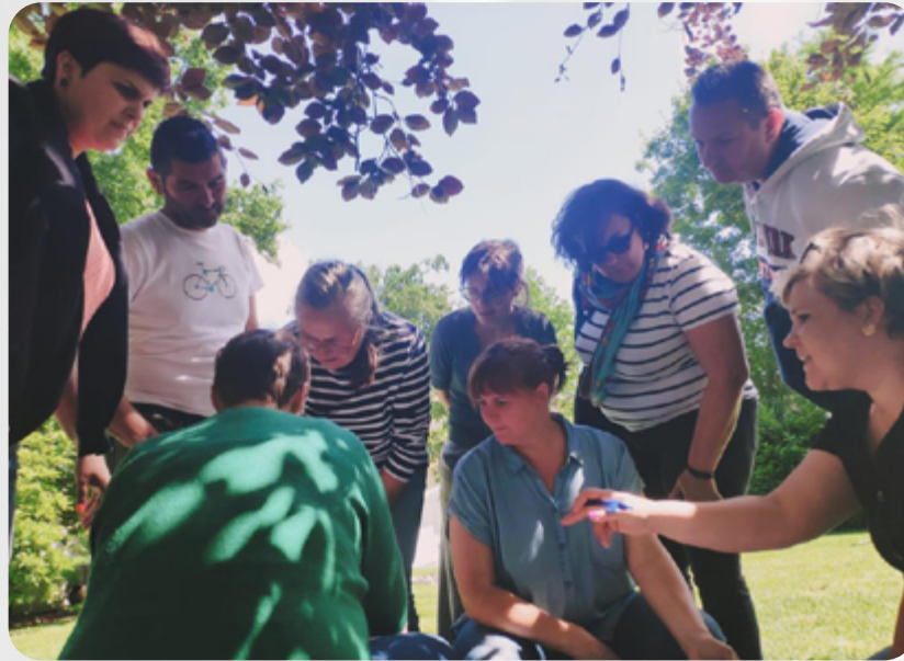
Wat deed de mol? Vooreerst: een essentiële bijdrage leveren.

Als je het spel echt wil spelen moet je bereid zijn om je op dat moment egoïstisch te gedragen, en dat viel me best wel zwaar. Maar het spel was op zich leuk. Ik denk dat de groep dat ook vond.