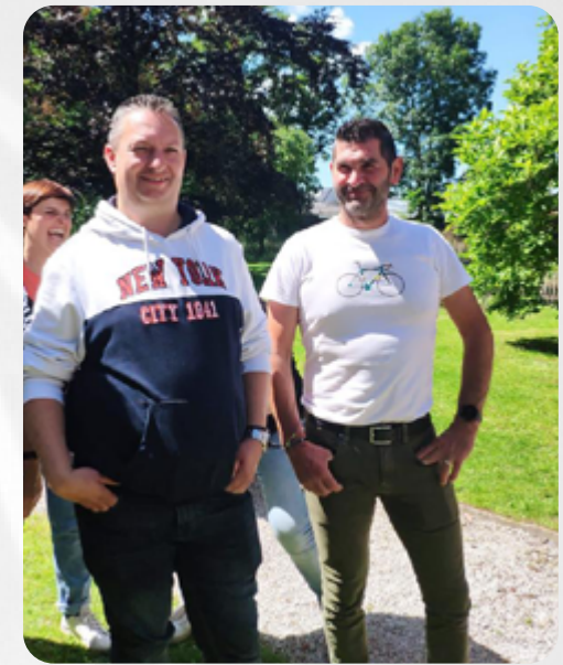
Een beetje El Sympatico uithangen.