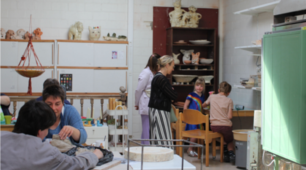
DAGCENTRUM 358 - EERSTE DEELNAME AAN ATELIER IN BEELD

Op zaterdag 14 mei namen de kunst ateliers voor de eerste keer deel aan 'Atelier in beeld,' een initiatief van Kunstwerk(t). We mochten 77 bezoekers verwelkomen, een gemengd publiek van bekende en nieuwe