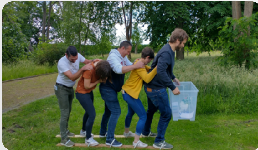
Vanuit de achtercockpit het marsritme bepalen.