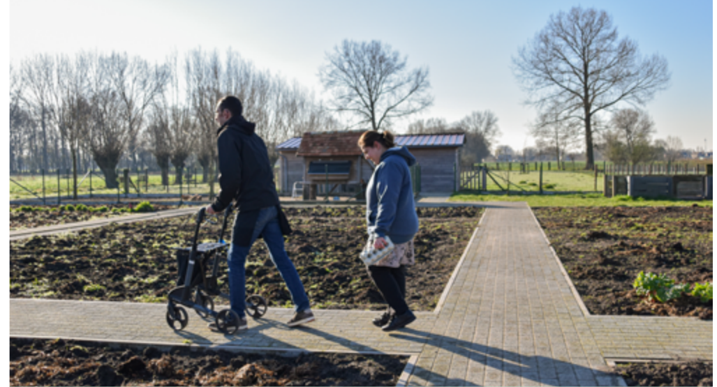
DAGCENTRUM 358 - HERAANLEG VAN DE TUIN

gezichten, waaronder ook burens. De bezoekers konden de medewerkers in actie zien en toonden veel interesse voor hun werk. Omdat het hele gebouw geopend was, waren ook alle kunstwerken te bezichtigen.